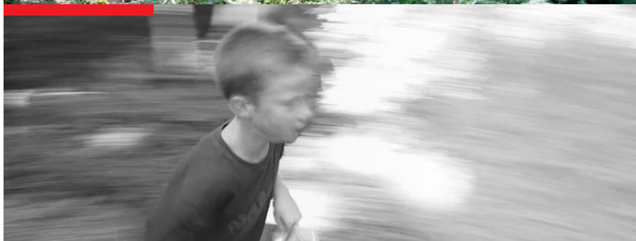
Schwarzweiss-Foto und rote Marke