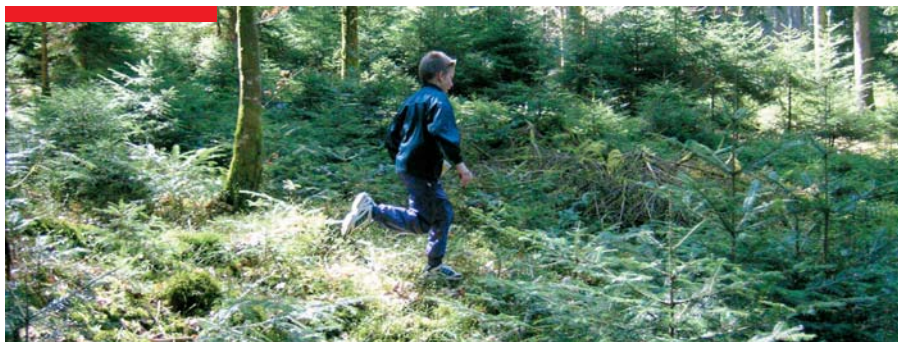
Farbfoto und rote Marke

Als flächige Elemente sollen vermehrt Fotos in Farbe und Schwarzweiss eingesetzt werden.