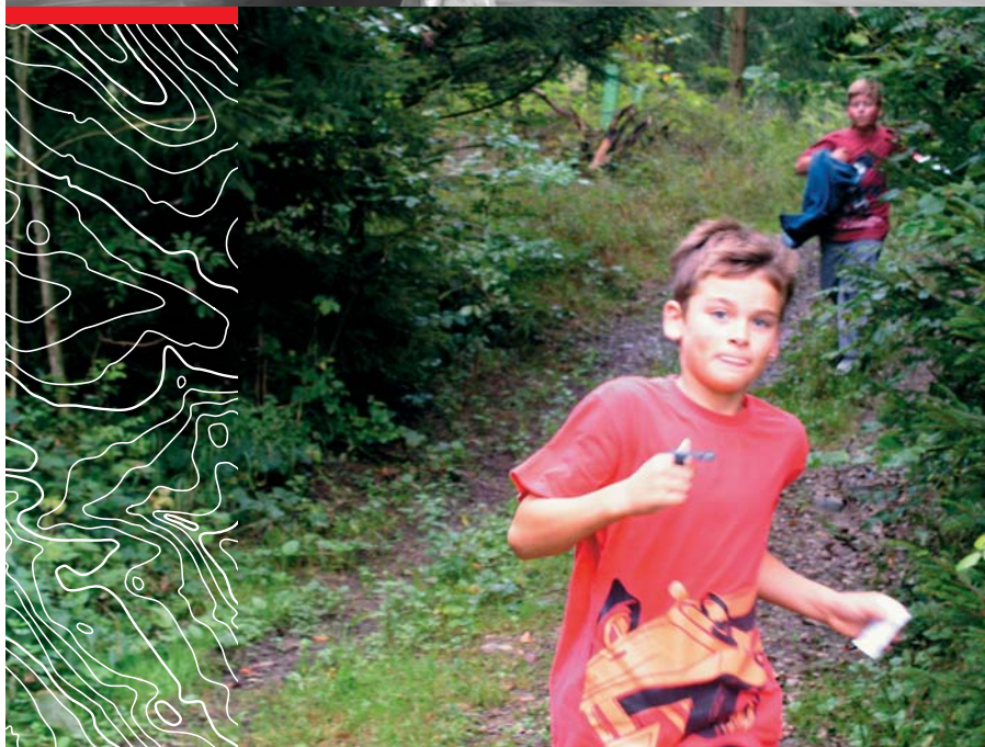
Farbfotografie kombiniert mit negativen Höhenkurven